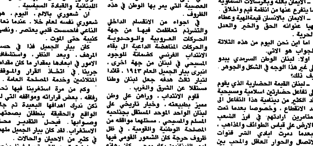
زيارة ضريح الراحل